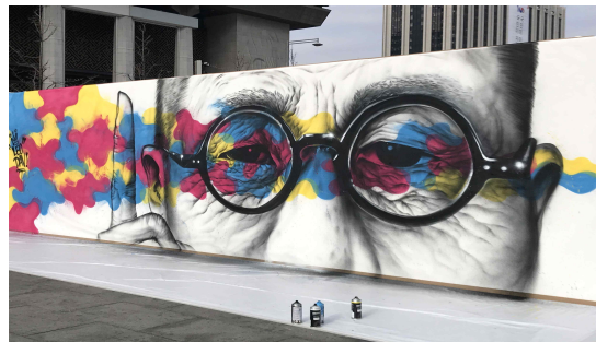
▲ 작가 LEODAV의 '백년의 눈빛'