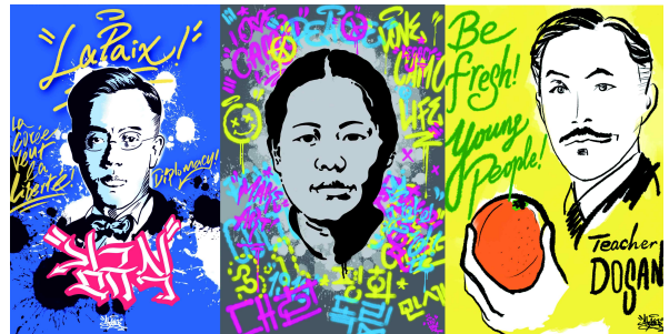
▲ 외교부청사에 걸린 독립운동가 그래피티 : 왼쪽부터 김규식, 유관순, 안창호