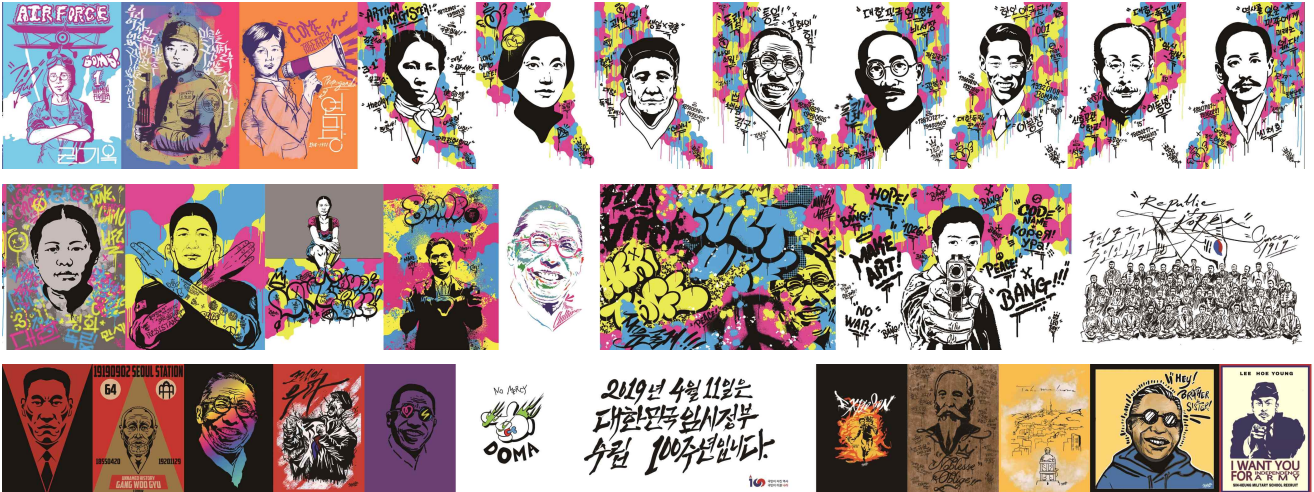
▲ 시민열린마당 울타리에 붙여진 그래피티 작품들 : 첫줄 왼쪽부터 권기옥, 오광심, 연미당, 김란사, 정정화, 곽낙원, 김구, 차리석, 이봉창, 이동녕, 신채호/ 유관순, 남자현, 유관순, 윤봉길, 김구, 김구, 안중근, 임정요인들/ 나석주, 강우규, 김구, 안중근, 김구, (안중근), (4.11홍보문), 윤봉길, 이상룡, 안중근, 김구, 이회영 등

□ 총 50여 점에 달하는 이번 전시작들 중에는 민족의 자주독립을 위해 기꺼이 삶을 희생했지만 그동안 대중적으로 널리 알려지지 못했던 인물도 다수 포함되어 있다.