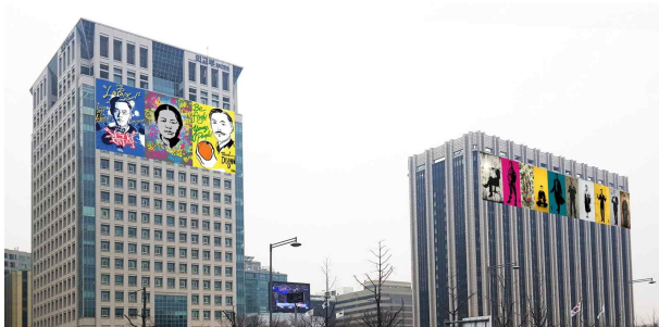
▲ 정부서울청사 및 외교부 조감도

○ 외교부청사에 걸린 세 명의 독립운동가는 김규식, 유관순, 안창호이다. 정부서울청사에 걸린 작품들과는 또 다르게, 보다 현대적으로 재해석 되었고 화려하고 다채로운 색감으로 표현되어 있다.