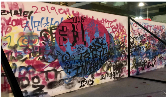
▲ 시민참여로 완성한 100주년 그라피티