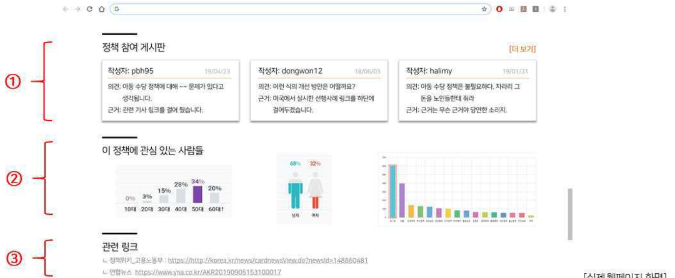
[실제 웹페이지 화면]